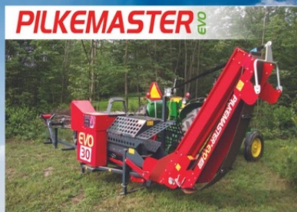
PROCESSEUR À BOIS

11 480, boul. du Parc-Industriel, Bécancour (Ste-Gertrude) G9H 3P3 gestionjoanmarcel2@hotmail.com